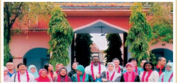
मलेशिया सरकार का शैक्षणिक दल कॉलेज परिसर में