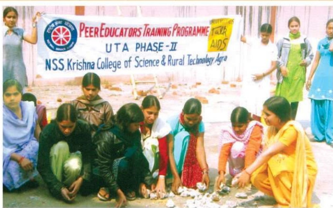
राष्ट्रीय सेवा योजना में कार्यरत छात्रायें