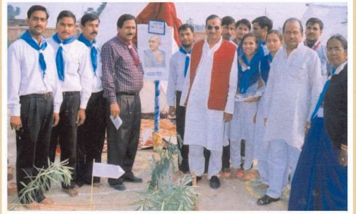
कृष्ण कॉलेज ऑफ स्पोर्ट्स एण्ड एजुकेशन रोवर्स एण्ड रेंजर्स कैम्प में चेयरमैन अतिथि