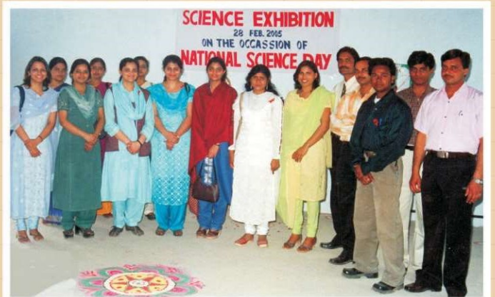
विज्ञान प्रदर्शनी का अवलोकन करते छात्र-छात्राएं एवं आगन्तुक