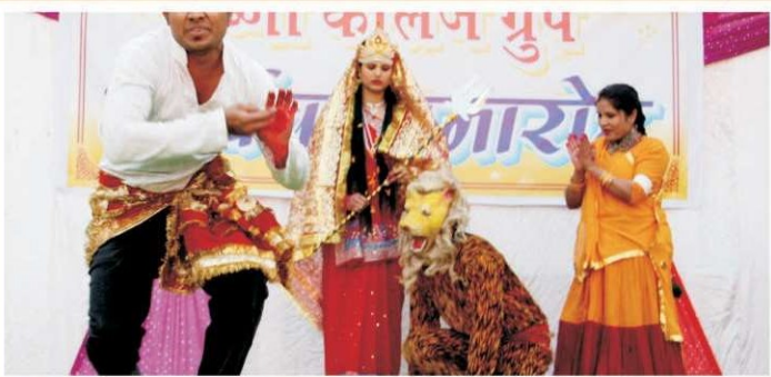
छात्रों द्वारा प्रस्तुत कार्यक्रम की एक झलक