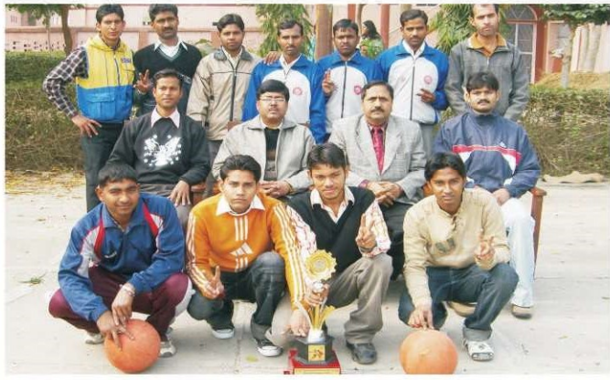
अलीगढ़ में आयोजित अन्तरविश्वविद्यालय बॉस्केट बॉल प्रतियोगिता में रनर अप रही कॉलेज की टीम कॉलेज प्रशासन के साथ