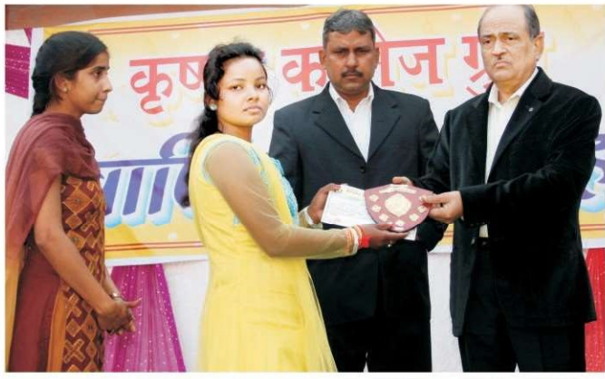
मलेशिया सरकार का शैक्षणिक दल कॉलेज परिसर में