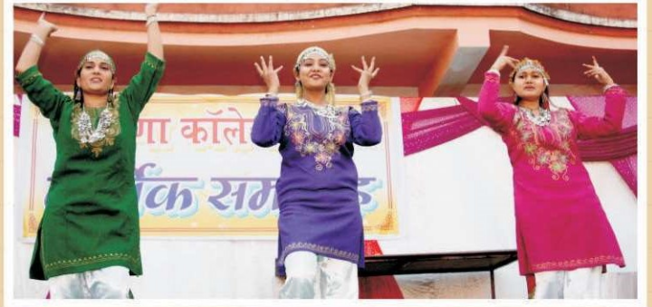
वार्षिक समारोह में छात्राओं द्वारा नृत्यकला की झलक